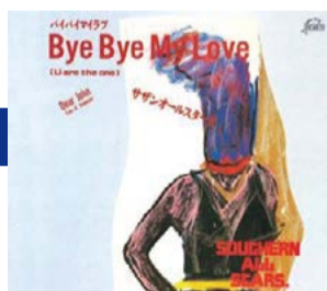
『Bye Bye My Love (U are the one)』(バイ・バイ・マイ・ラヴユー・アー・ザ・ワン)。1985年5月発売

青学(青山学院大学)の先輩でもあるサザンオールスターズの桑田さんの声が大好きなんです。高校時代に「バイバイマイラブ」を聞いた時に、イントロがかかると瞬間にテンションが上がる自分がいた(笑)。もちろんプロに入ってからずっと聞いています。