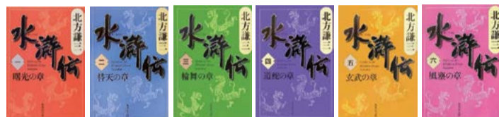
「水滸伝」1～19巻 北方謙三 集英社文庫

歴史が苦手だったので、歴史小説って嫌いで全然読んだことはありませんでした。でもここ数年、年を重ねたせいか歴史ものを読みたいなって思った時に、北方謙三先生の「水滸伝」に出会いがありました。で、たまたま「水滸伝」を読んでいる時にインタビューで、今読んでいる本を聞かれ答えたら、それを偶然見ていた北方先生が対談に呼んで下さって。それからお付き合いさせていただくことになったんですが、普通だったら絶対お会いしない方と、本を通じて繋がりができたという意味では転機になった本でもあります。