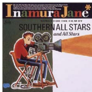
『希望の轍』1990年に公開された映画『稲村ジェーン』のサウンドトラックアルバム『稲村ジェーン』(1990年9月発売)の2曲目に収録。